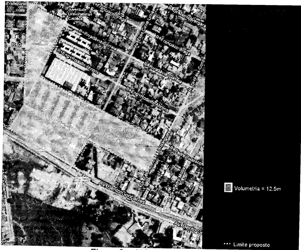
Figura 2 – AIC Vila Olímpica