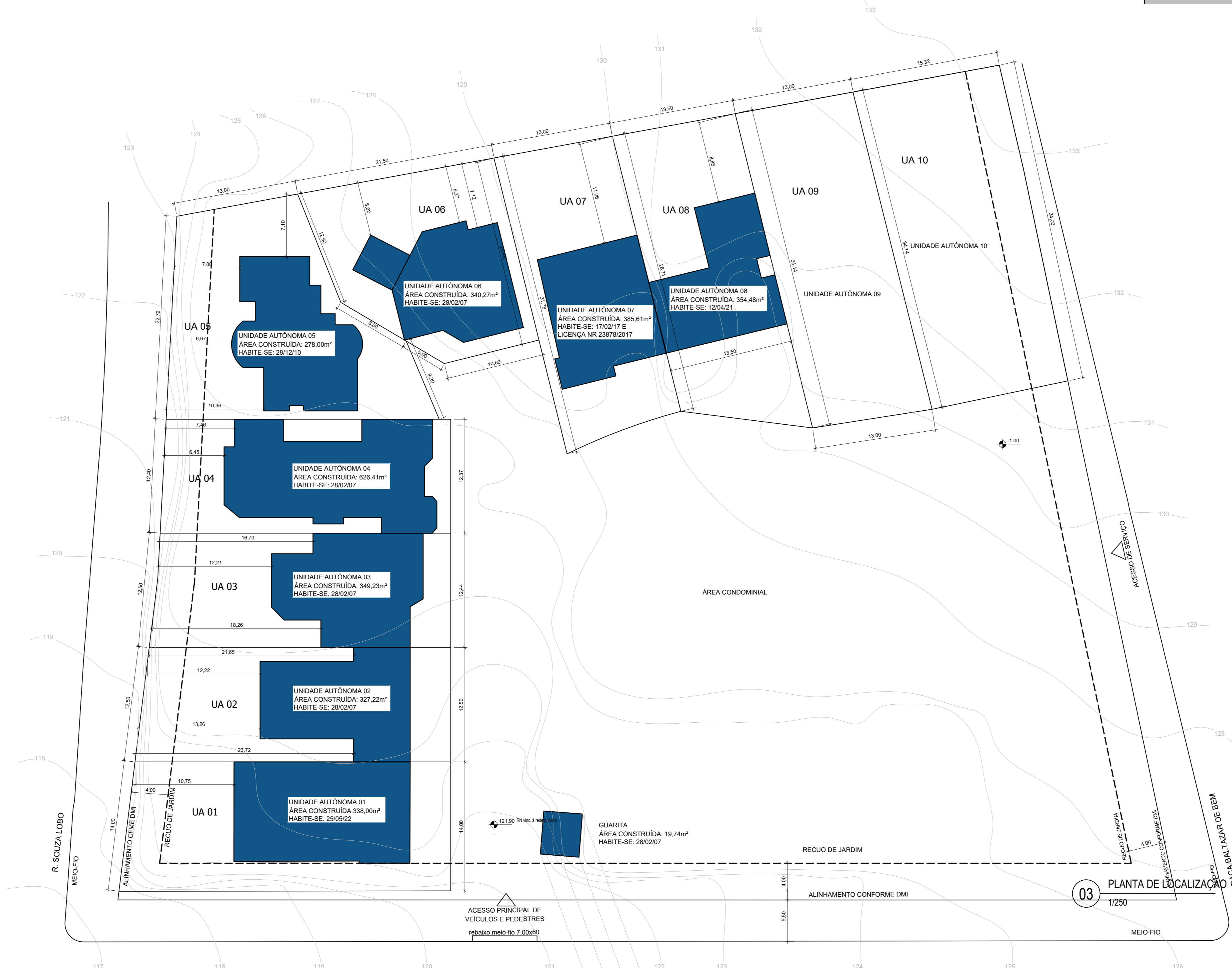
PLANTA DE LOCALIZAÇÃO ESCALA 1/250