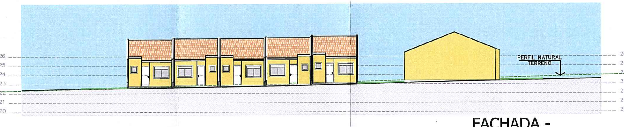
FACHADA - RUA OLÍMPIO TABAJARA Escala 1:250