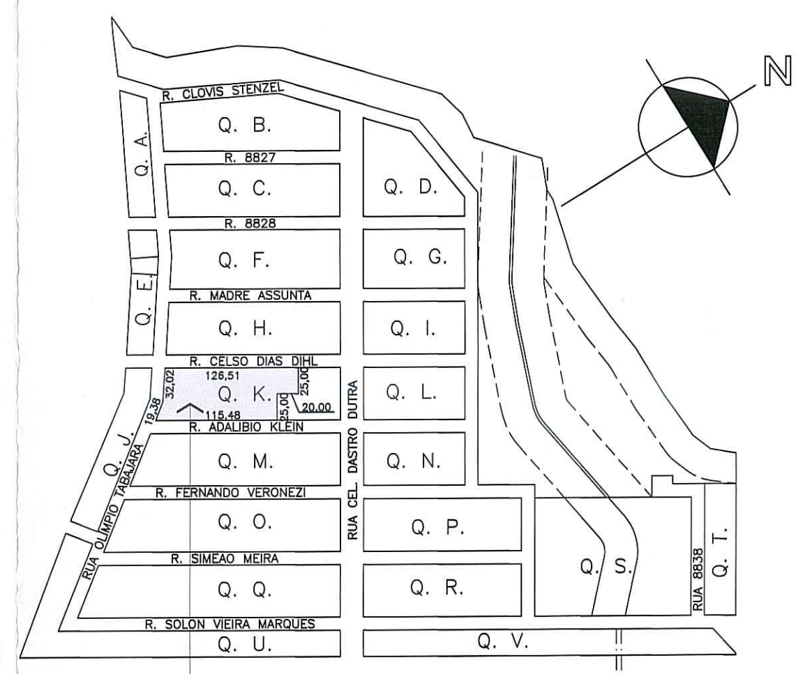
SITUAÇÃO Escala 1:5000