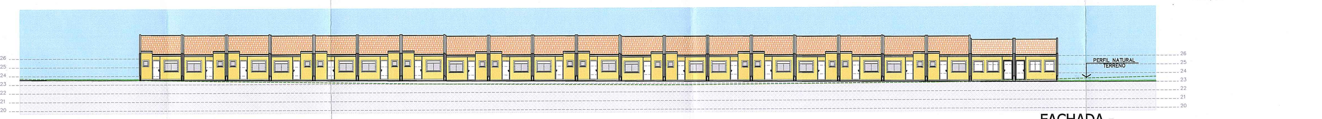
FACHADA - RUA ADALBIO KLEIN Escala 1:250