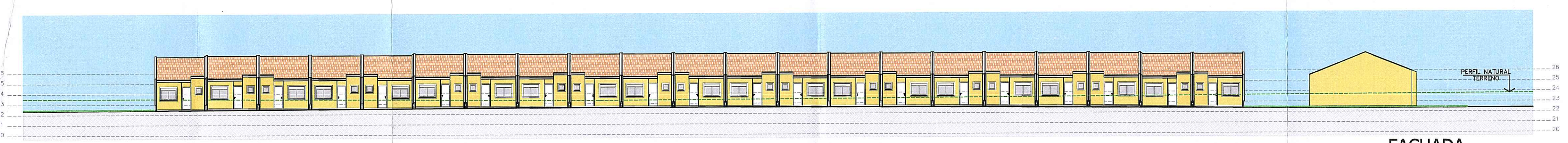
FACHADA - RUA CELSO DIAS DIHL Escala 1:250