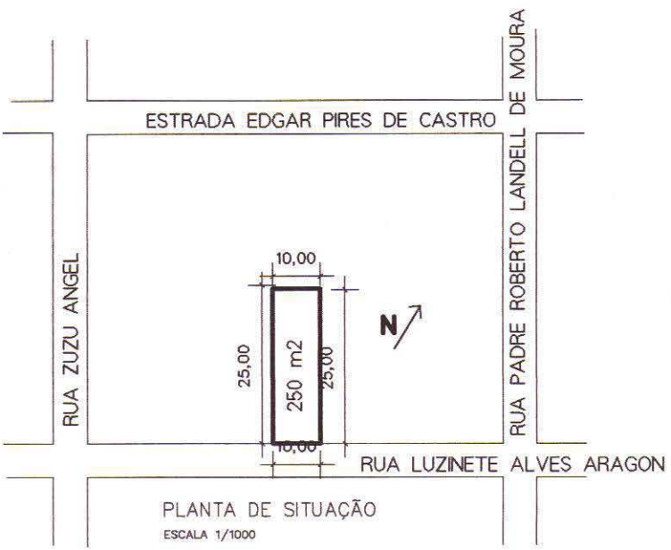
PLANTA DE SITUAÇÃO ESCALA 1/1000