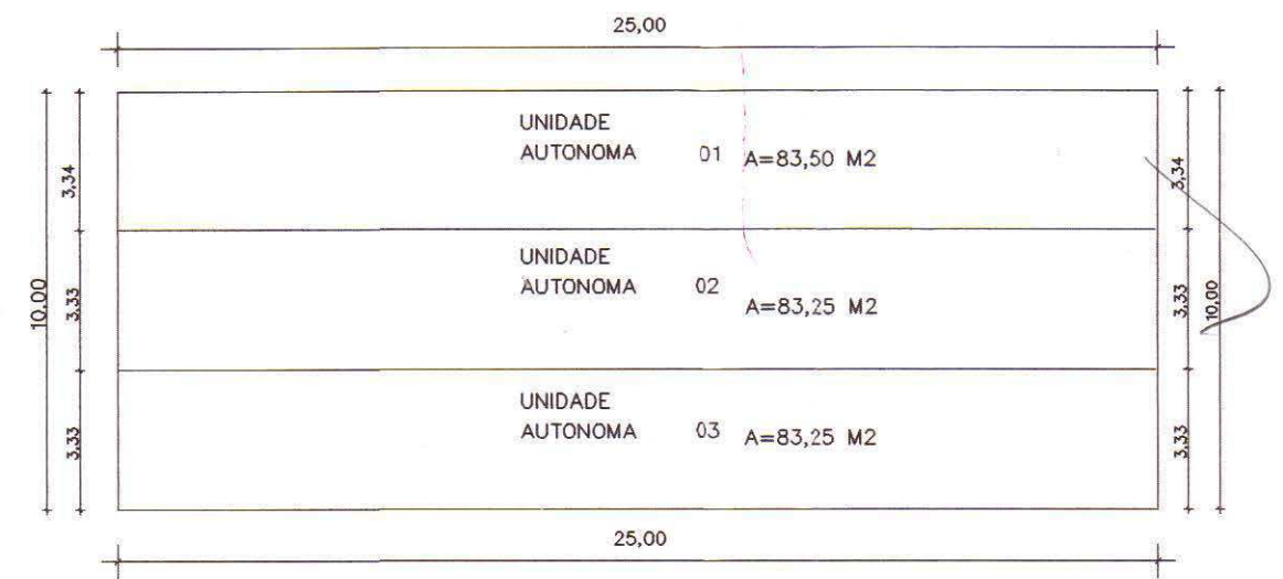
PLANTA DE LOCALIZAÇÃO 02 ESCALA 1/200