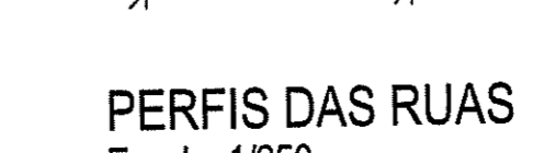
PERFIS DAS RUAS Escala: 1/250