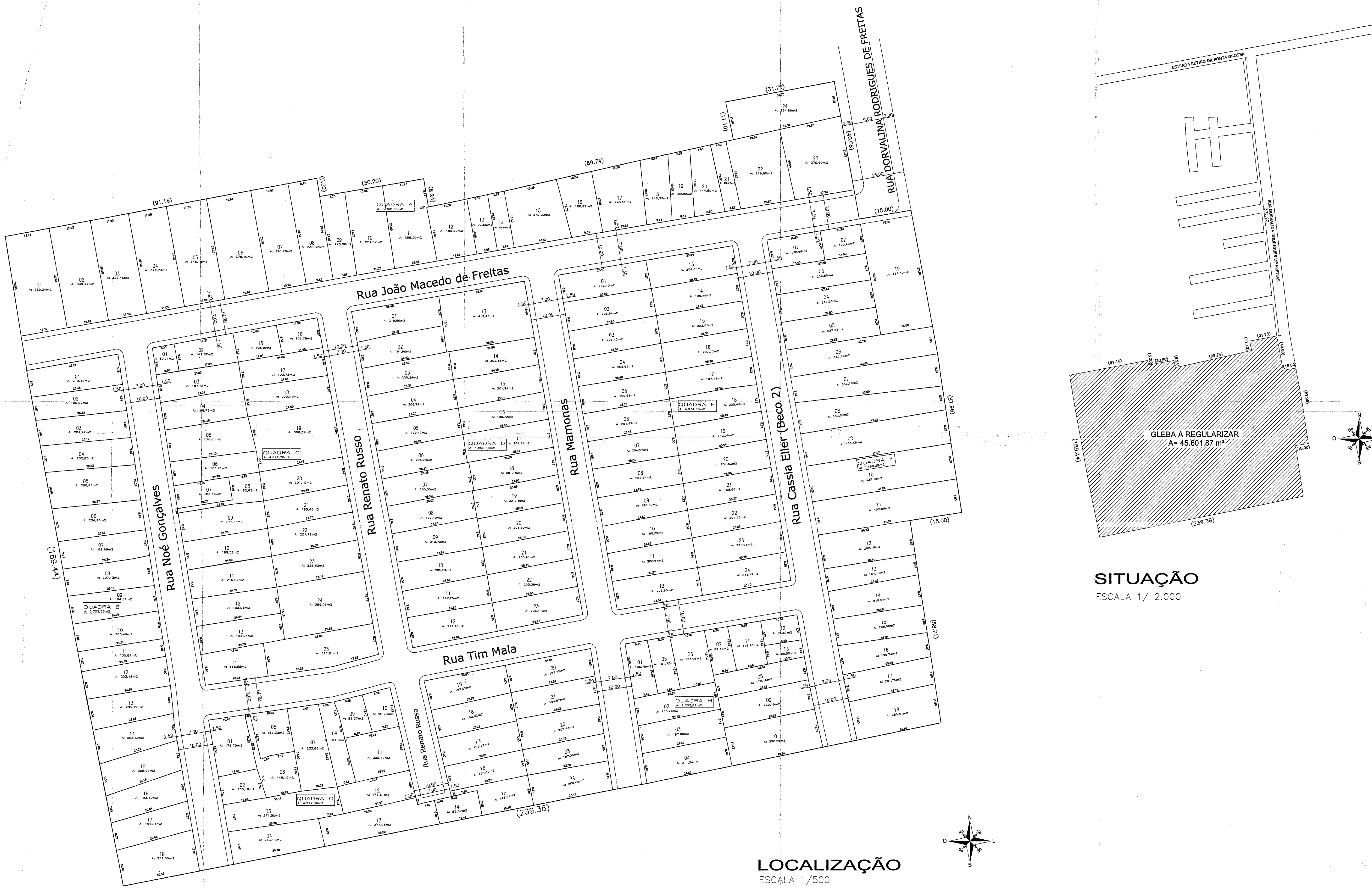
SITUAÇÃO ESCALA 1/ 2.000