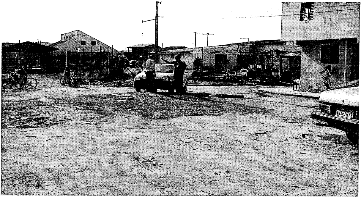
Na praça e ao fundo posto saúde e creche, mais casas e campo futebol.